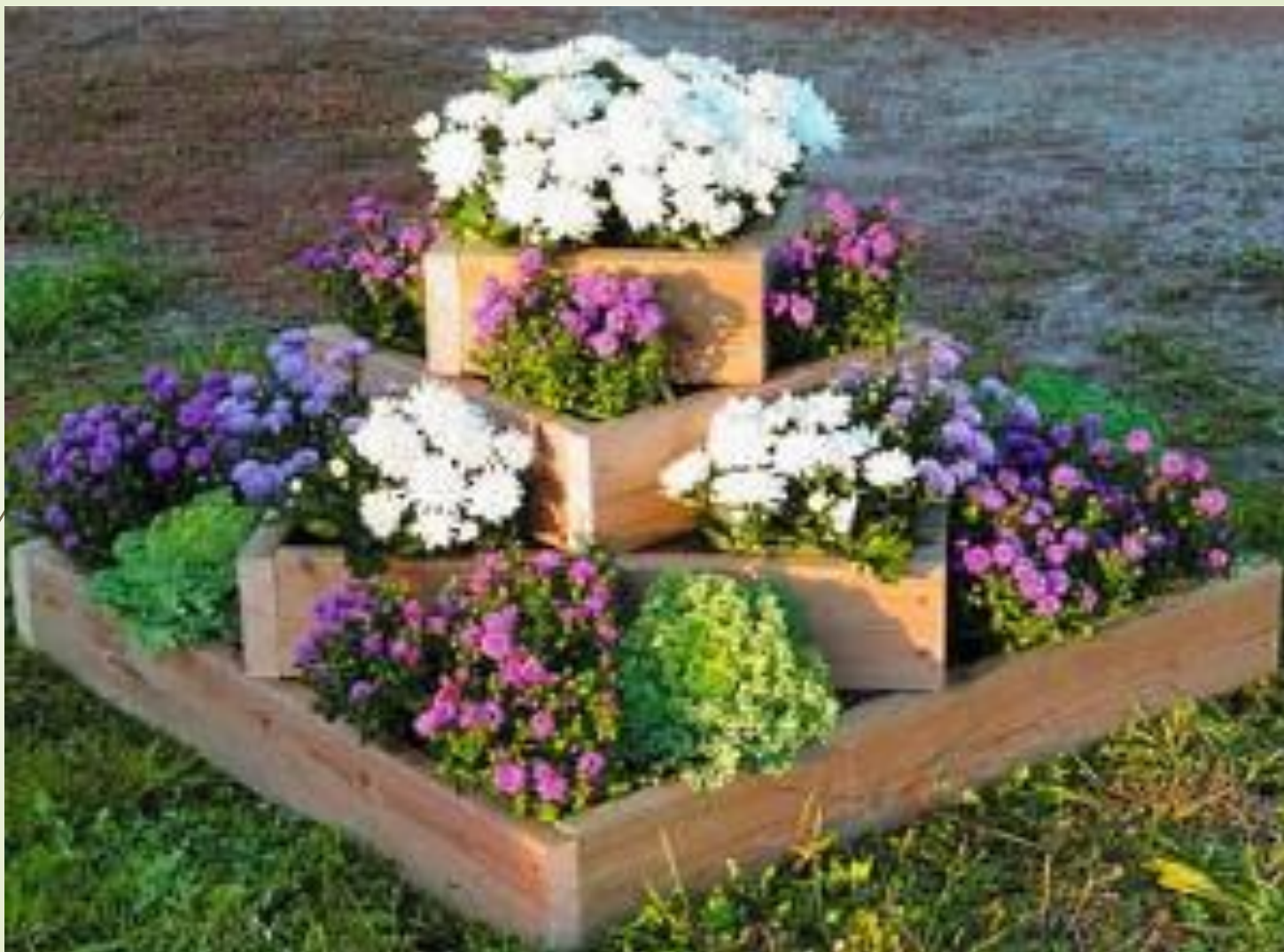
Схема нашей клумбы в 2015-2016 году