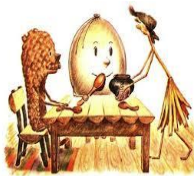
Жили-были пузырь, соломинка и лапоть.